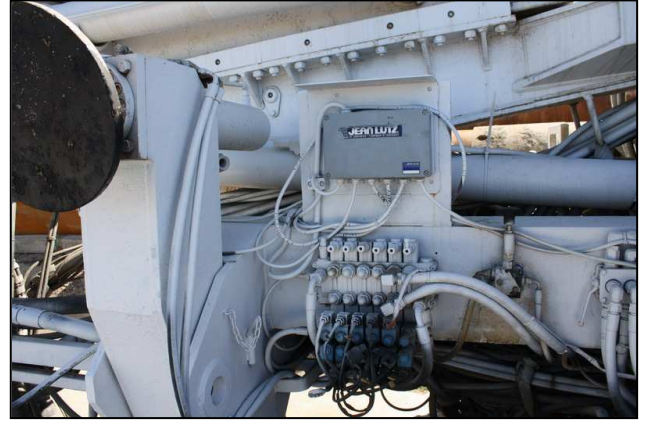
Système enregistreur Lutz