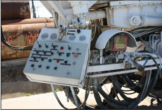
Panneau de commande