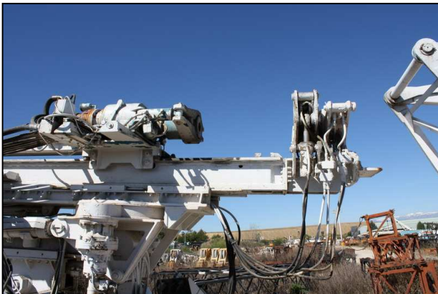
Tête de rotation 2 vitesses